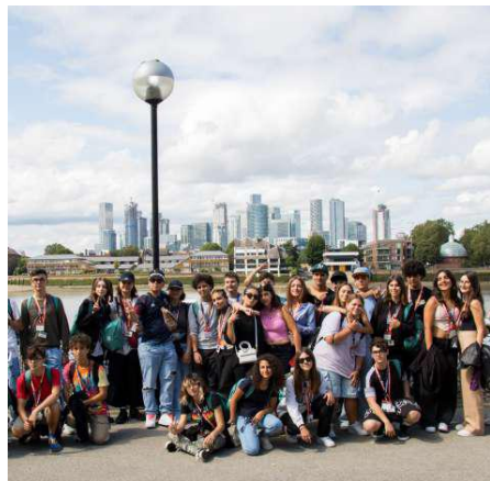
Elevi in excursie la Londra