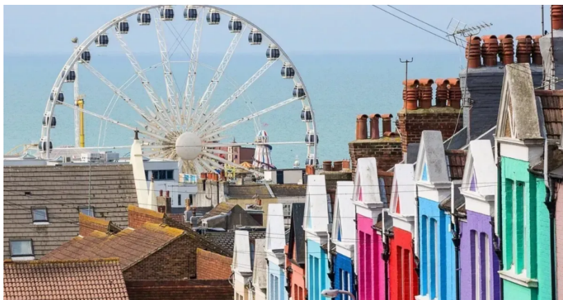
Excursie la Brighton