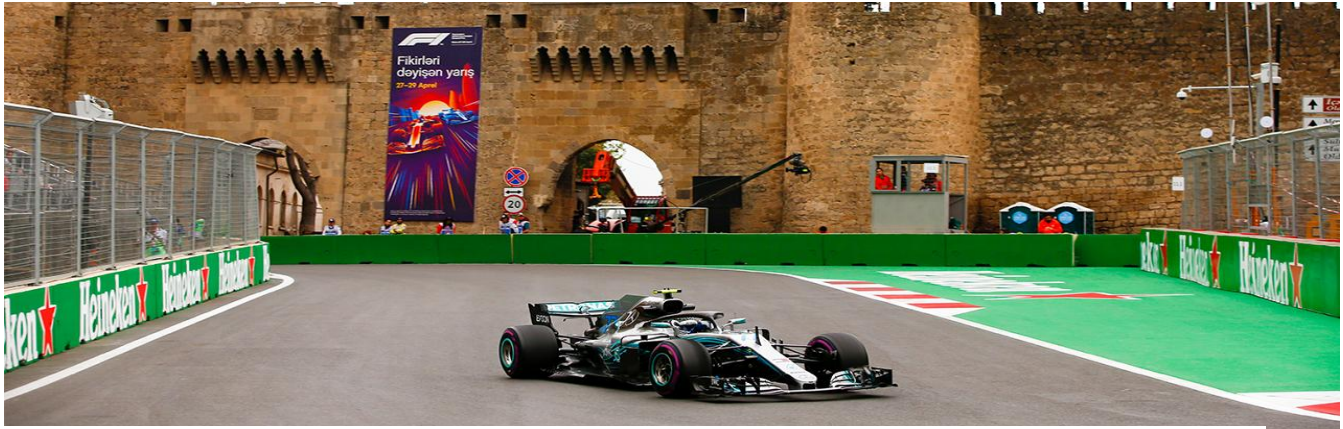
Tribuna Icheri Sheher

Tribuna principală Absheron de la sfârșitul dreptei principale ar trebui să fie în fruntea listei de dorințe de vizionare, deoarece veți urmări mașinile frânând de la aproximativ 350 km/h în virajul 1 cu 90 de grade - și probabil veți obține și cea mai mare parte a depășirilor. În altă parte, tribuna Icheri Sheher oferă un punct de vedere unic, în timp ce privești mașinile trecând prin secțiunea porțiile orașului și pornind până la complexul super-rapid turn 13-15.