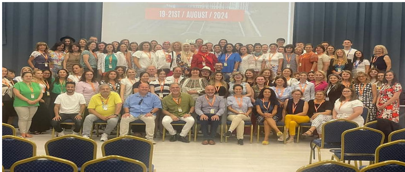
PROGRAMUL PE ZILE AL CONFERINTEI

AMBELE TIPURI DE BILETE INCLUD CERTIFICATE DE PARTICIPARE DECERNATE IN CADRUL UNEI CEREMONII DESFASURATE LA FINALUL CONFERINTEI.