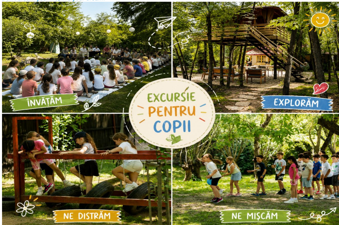
Pe ulitele copilăriei – O zi la satul din poveste